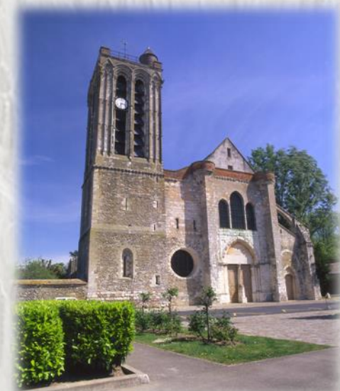
Collégiale Saint Martin de Champeaux

Le val d'Ancoeur est riche en édifices historiques, les plus réputés étant le château de Vaux-le-Vicomte et la collégiale de Champeaux. Ce circuit permet de voir le château fort de Blandy-les-Tours, le château de Bombon et Champeaux.