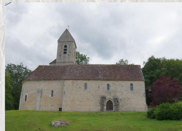
Eglise de Boissy aux Cailles

Sur les traces des Templiers et des Hospitaliers, Fourches vous livre ses secrets... et la vallée boisséenne vous mène au cœur d'un village de grès typique du Gâtinais français.