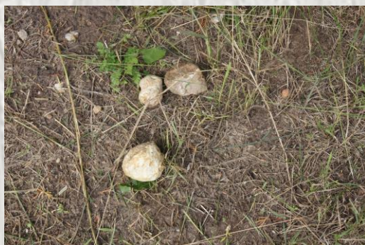
Cailloux ronds appelés cailles

Pour la toponymie on trouverait en 1113 l'appellation « Bussiacum » du nom latin Bussius qui veut dire « buis ». Ensuite la terre faisant partie des biens de l'Abbaye de Montmartre elle fut longtemps nommée Boissy le Repos car les sœurs y venaient faire « bonne chair et bon repos ». Le mot de « Cailles » qui lui a été accolé après 1793 est synonyme de cailloux. Il s'agit de petites boules de pierre naturellement polies que l'on trouve très fréquemment dans les champs alentours.