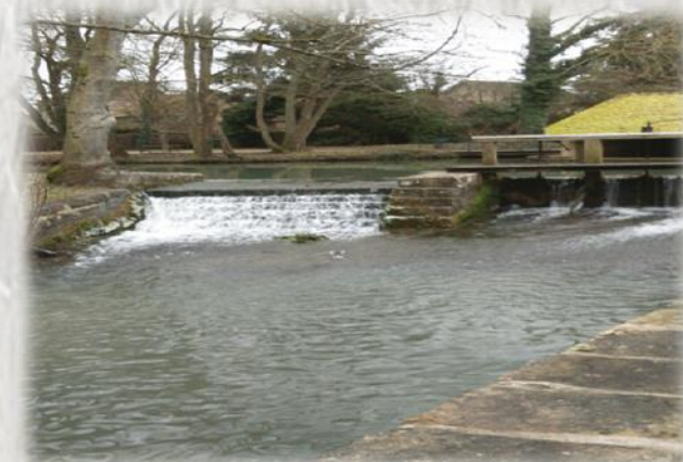
Lavoir de Voulx

Bocages et villages sont au rendez-vous de cet itinéraire pour offrir avec lavoir, église et château, la vision d'une campagne préservée.