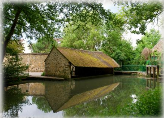
Lavoir à Voulx

L'élevage se visite de mars à fin octobre. Découvrez dans la boutique des conserves de volailles et autruches, des cosmétiques à l'huile d'autruche, des œufs décorés et des articles de maroquinerie.