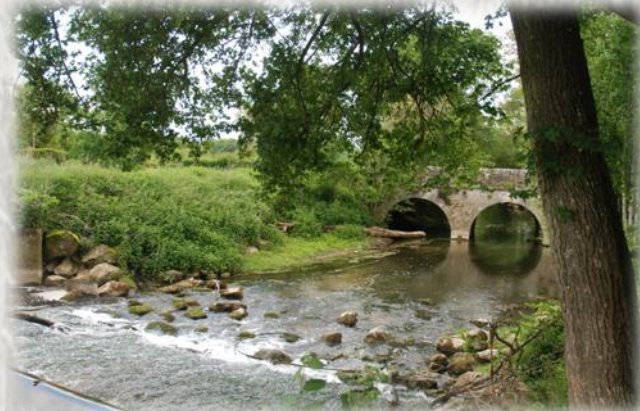
L'Yverres avant Argenteuil