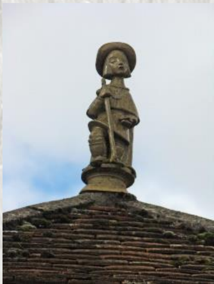
Le petit Pèlerin

Le service des postes, créé sous Louis XI, emprunte le grand chemin de Paris à Lyon, axe principal de la France médiévale. Les responsables des relais de poste étaient les chevaucheurs d'écurie du Roi. L'un des plus réputés chevaucheurs du relais fut François FOUGERET en 1540. Le futur Louis XIII, enfant, y fit une halte, d'où le nom d'Auberge du Dauphin donné à ce relais.