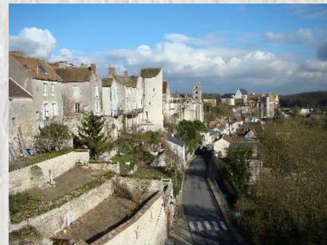
Vue panoramique de Château-Landon

Il paraît que sur ce parcours, le renard est inévitable. Il est des croyances... Quoiqu'il en soit, le circuit vous mène au travers des hameaux de Château-Landon de part et d'autre de la vallée du "Fusain". Il se conclut par la découverte du site exceptionnel de la ville puis, le long des remparts de celle-ci, en surplomb du méandre du "Fusain", vous apprécierez le spectacle des points de vue sur la vallée.