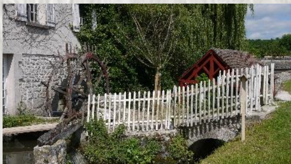
Moulin à Château-Landon

Qualifié "d'usine" sous Louis Philippe avec ses normes de fonctionnement, il deviendra moulin à grain pour se transformer en alternateur au début du XX e siècle, alimentant en électricité le moulin à grain des Gauthiers.