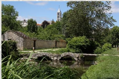
Le pont César

Le balisage de l'itinéraire que vous empruntez est réalisé et entretenu par les 250 baliseurs du comité départemental de la Randonnée Pédestre de Seine et Marne (Codérando 77). Il fait partie des 4500 km de chemins de promenade et de randonnée existant sur le département.