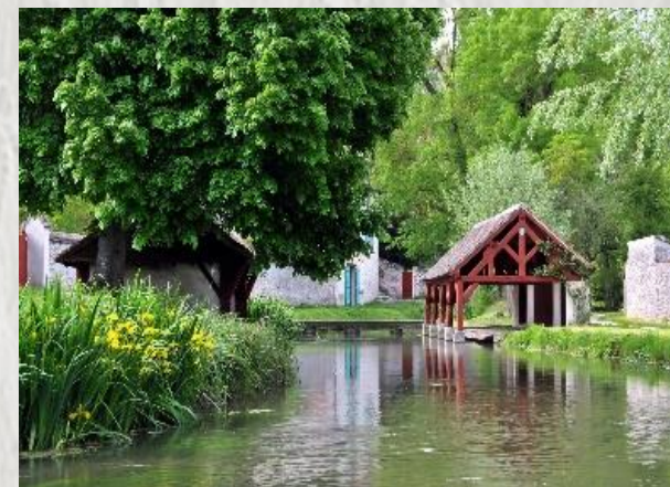
Le fusain

Le Fusain, affluent du Loing, se trouve si bien au pied de Château-Landon qu'il se divise en plusieurs bras pour occuper le fond de vallée. Fond de vallée que ce circuit permet de découvrir, à niveau puis en hauteur.