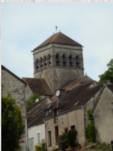
L'Eglise Saint-Loup de Naud

Cette bâtisse contient un très beau mobilier et une exceptionnelle collection de miroirs anciens.