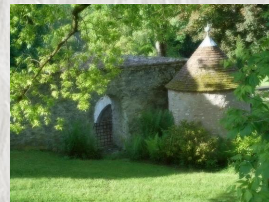
Vestige de la Léproserie de Sainte-Colombe