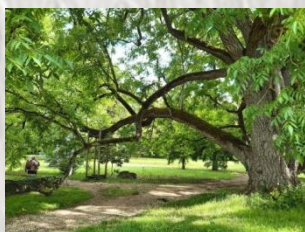
Parc Debreuil : arbre remarquable

On y trouve un arbre remarquable, exceptionnel par ses dimensions : un noyer noir d'Amérique