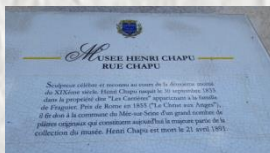
Le Mée sur Seine : musée Henri Chapu