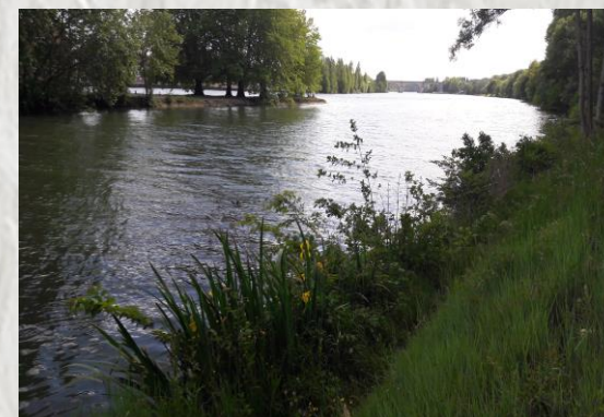
Le Mée sur Seine : bords de Seine

En parcourant cette boucle, vous découvrirez les limites de la commune du Mée-sur-Seine, voisine de la ville préfecture qu'est Melun.