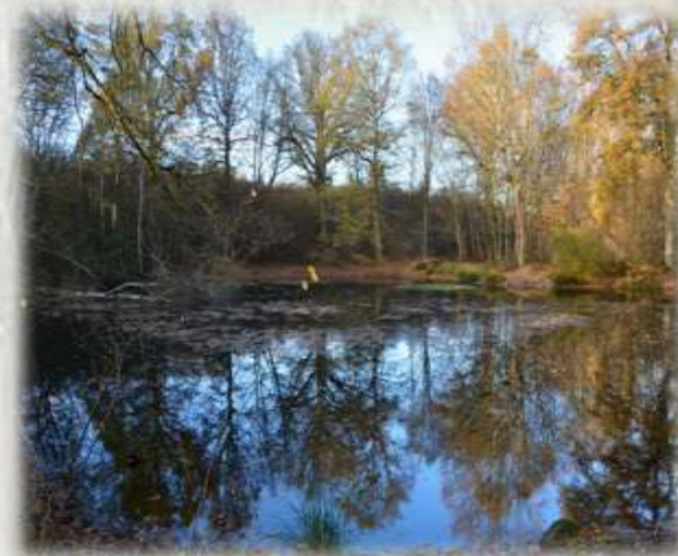
La Mare Périlleuse – Héricy

Sans doute l'écrivain Stéphane Mallarmé avait-il déjà apprécié cette balade vers la mare Périlleuse, proche de son domaine... « Tout est joli, de mille verts et parfumé », admirait-il au printemps 1896.