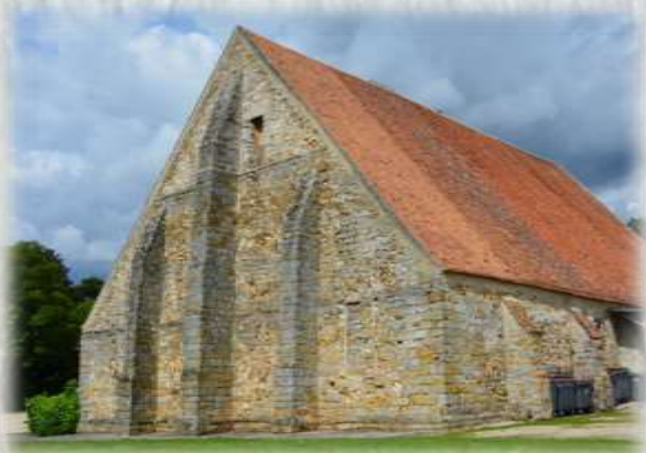
La grande aux Dîmes à Samoreau

Le musée départemental Stéphane Mallarmé fait face à la Seine et à la forêt de Fontainebleau. Au travers des objets de son quotidien, de ses œuvres et de celles de ses amis peintres et sculpteurs, le musée restitue l'intimité et l'univers du poète. C'est en 1874 que Stéphane Mallarmé découvre au lieu-dit Valvins, cette ancienne auberge pour les cochers d'eau. Pendant vingt ans, il y loue deux pièces pour de courts séjours en famille, principalement à la Toussaint, à Pâques et en été. Ce n'est qu'à sa retraite qu'il loue quatre pièces supplémentaires pour des séjours en solitaire plus longs. Ces moments à Valvins sont pour lui une nécessité et un vrai ressourcement. Le canotage sur la Seine et le jardinage sont les grands plaisirs de Mallarmé. Il y meurt le 9 septembre 1898 et est enterré avec sa famille au cimetière de Samoreau. Achetée en 1902 par Geneviève Mallarmé, la fille du poète, la maison est inscrite à l'inventaire des monuments historiques en 1946 et reste la propriété des héritiers jusqu'en 1985. Elle est alors acquise, avec son mobilier et sa bibliothèque, par le Conseil Départemental de Seine-et-Marne. Le musée ouvre au public en 1992.