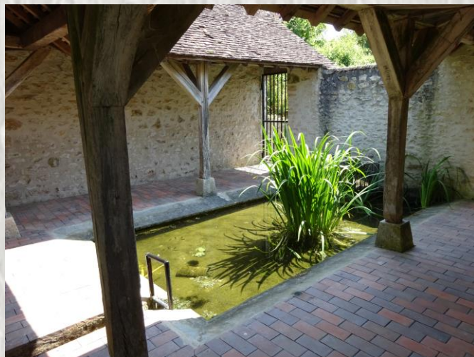
Mons-en-Montois : Le lavoir