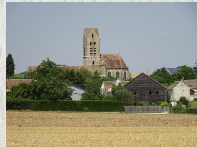
Mons-en-Montois : l'Église

Derrière ce titre se cache un épisode horrible de la guerre de cent ans : le massacre de 234 habitants de Mons-en-Montois, brûlés vifs dans leur église. Ce douloureux épisode nous ramène à une époque récente, le 10 juin 1944, où 642 habitants d'Oradour-sur-Glane furent massacrés dont 350 brûlés vifs dans l'église. Cette randonnée, à travers les grands horizons de la Brie, devrait nous inciter à méditer sur toutes les horreurs de la guerre commises à travers les siècles et dans tous les pays et comment les empêcher.