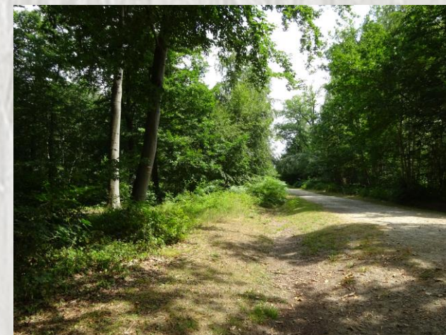
La forêt de Montceaux

A la découverte de Varreddes et Germigny-l'Évêque, anciennes résidences d'été des évêques de Meaux. Pigeonnier, tourelle et terrasse rappellent aujourd'hui les vestiges d'un château édifié par le prédécesseur de Bossuet.