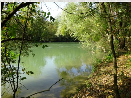
La Marne

Ce remarquable musée ouvert en 2011, présente l'originalité d'être plus un lieu de compréhension que de recueillement. Une mise en regard des batailles de la Marne de 1914 à 1918 montre les bouleversements qui ont fait passer le monde du XIX ème au XX ème siècle. Le musée renvoie aussi vers les sites du nord seine-et-marnais où subsistent des témoignages de la Première Guerre mondiale.