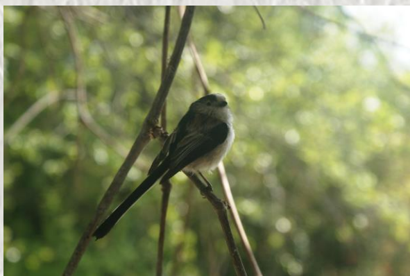
Mésange longue queue

Le massif de Villefermoy a été classé zone Natura 2000 : il abrite de nombreuses d'espèces ornithologiques rares. Certaines sont remarquables au plan régional : bondrée apivore, busard Saint Martin, milan noir, martin-pêcheur d'Europe, pic cendré, pic mar, pic noir et surtout l'autour des palombes et le torcol fourmilier.