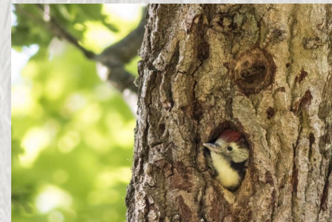
Nid de Pic Epeiche – Photo : ONF - Renaud Trangosi ©

La forêt de Villefermoy, un peu à l'écart des grands itinéraires mérite le détour. Cette forêt constitue une zone humide du plus haut intérêt pour la flore et surtout la faune. Pour la parcourir, mieux vaut bien s'équiper, mais c'est une expérience que vous ne regretterez pas.