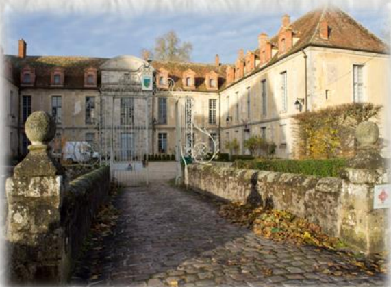
La Chapelle-Gauthier