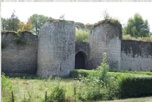
Château de Mez

Le château est érigé au croisement des vallées du Betz et de l'Ardoise, dans une position très rare pour un château médiéval car implanté en fond de vallée. Le château serait vraisemblablement construit sur des structures romaines et gallo-romaines (voie de César). L'édifice est constitué d'une grande enceinte carrée (d'environ 60m de côté) construite au début du XIIIème siècle. Elle comporte quatre tours de flanquement, circulaires aux angles, et une porte à deux tours aménagée au centre de la face nord.