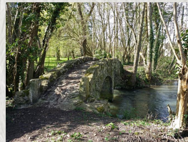
Pont romain à Bransles

En limite du Loiret, parfois sur le plateau, parfois en fond de vallée, suivez les cours des Ardouzes et du Betz jalonnés de lavoirs, vieux moulins, gués et anciens ponts.