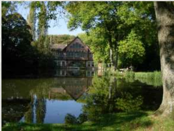
Ferrières-en-Brie : la buanderie

En 1829, James Mayer, baron de Rothschild, fit l'acquisition du domaine de Ferrières, qui avait appartenu à Joseph Fouché, ancien Ministre de la police. A compter de 1855, et en quatre ans, il fit construire par Joseph Paxton, architecte et paysagiste anglais un nouveau château au confort raffiné, et à l'architecture inspirée de la renaissance italienne. Le parc de 400 hectares entourant le château, dessiné à la mode anglaise avec lacs, passerelles, jardin japonais, serre et roseraie, reçut la plantation de très nombreuses espèces. En 1862, Napoléon III vint y planter un séquoia qui a résisté aux tempêtes. Le domaine qui se visite est désormais propriété de la Chancellerie des Universités de Paris.