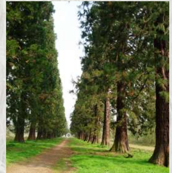
L'allée des séquoias à Pontcarré

Ce circuit vous permettra de découvrir une forêt typique du plateau briard, et aussi d'apercevoir le château de Ferrières-en-Brie, avec certains des aménagements ou plantations liées à sa construction.