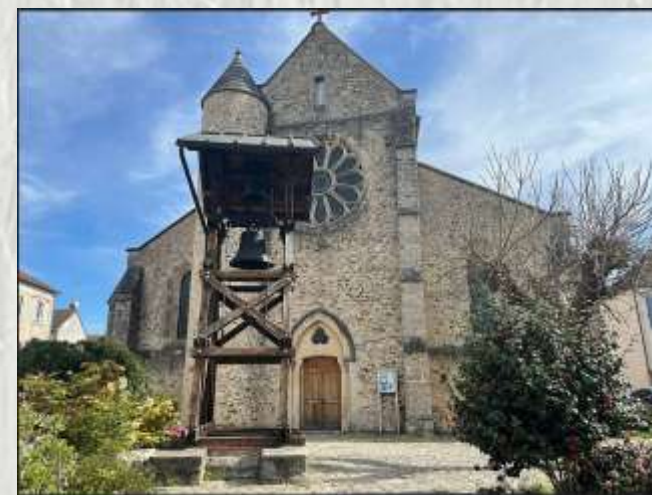
Ferrières-en-Brie : l'église

Ce circuit vous permettra de découvrir une forêt typique du plateau briard, et aussi d'apercevoir le château de Ferrières-en-Brie, avec certains des aménagements ou plantations liées à sa construction.