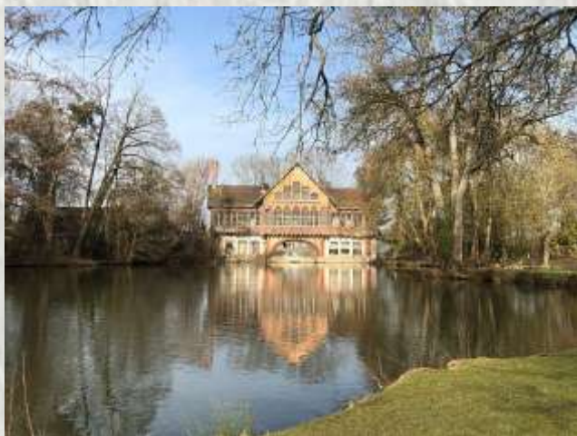
Ferrières-en-Brie : la buanderie

En 1829, James Mayer, baron de Rothschild, fit l'acquisition du domaine de Ferrières, qui avait appartenu à Joseph Fouché, ancien Ministre de la police. A compter de 1855, et en quatre ans, il fit construire par Joseph Paxton, architecte et paysagiste anglais un nouveau château au confort raffiné, et à l'architecture inspirée de la renaissance italienne. Le parc de 400 hectares entourant le château, dessiné à la mode anglaise avec lacs, passerelles, jardin japonais, serre et roseraie, reçu la plantation de très nombreuses espèces. En 1862, Napoléon III vint y planter un séquoia qui a résisté aux tempêtes. Le domaine qui se visite est désormais propriété de la Chancellerie des Universités de Paris.