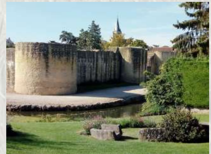
Le château de Brie-Comte-Robert

Ce parcours autour de Brie-Comte-Robert vous permettra d'en découvrir les différentes facettes. D'abord, le centre historique avec son château, son église et quelques belles façades. Puis, de façon plus inattendue, un parcours « nature » autour de la ville, avec en particulier, le parc François Mitterrand. Enfin, pour terminer, un tronçon du Chemin des Roses.