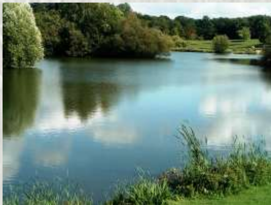
Le parc F. Mitterrand à Brie-Comte-Robert