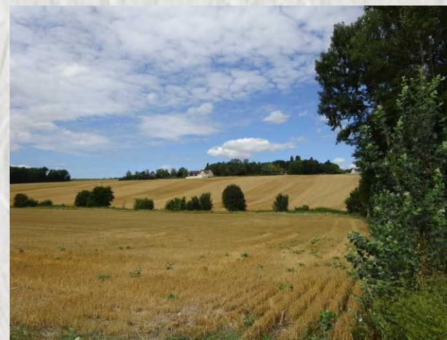
Vallon de Raboireau, les Limons de Chauffry

Au cours de cette randonnée, vous découvrirez des vergers expérimentaux installés par le lycée agricole du château de La Bretonnière.