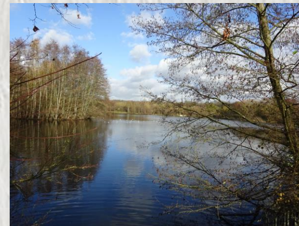
L'étang de la Broce

Ce circuit dans la ville nouvelle de Marne-la-Vallée va vous surprendre. A peine sorti du RER, nous longeons un étang, un vignoble et un charmant ruisseau. Nous enchaînons par l'ancien village, le moulin Russon et l'étang de la Loy avant d'atteindre le parc de Rentilly avec ses arbres exotiques et son château « transparent ». Mais, c'est déjà le retour au RER après une halte à l'étang de la Broce.