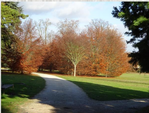
Le parc de Rentilly

Château de Rentilly a été entièrement recréé par l'artiste Xavier Veilhan et inauguré en 2014. Le bâtiment entièrement recouvert de feuilles d'acier inoxydable laisse une impression de transparence pour ne pas perturber l'environnement paysager exceptionnel. Ce parc faisait partie du patrimoine de la famille Menier.