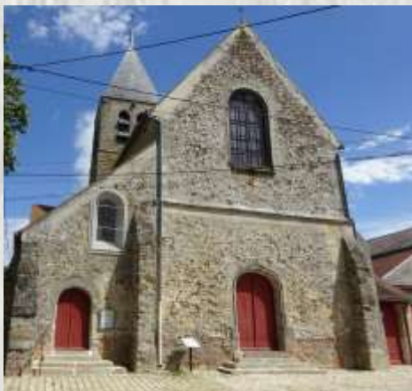
L'Église de Touquin

En 2004, il fut découvert un mur d'1,40 m d'épaisseur, des XIIème et XIIIème siècles, époque des grandes foires de Champagne. Il appartient à un important édifice encore non identifié. En 2006, la partie sud d'une nécropole mérovingienne du XIIème siècle fut mise à jour. Aujourd'hui, les fouilles continuent, certaines découvertes sont exposées dans la mairie.