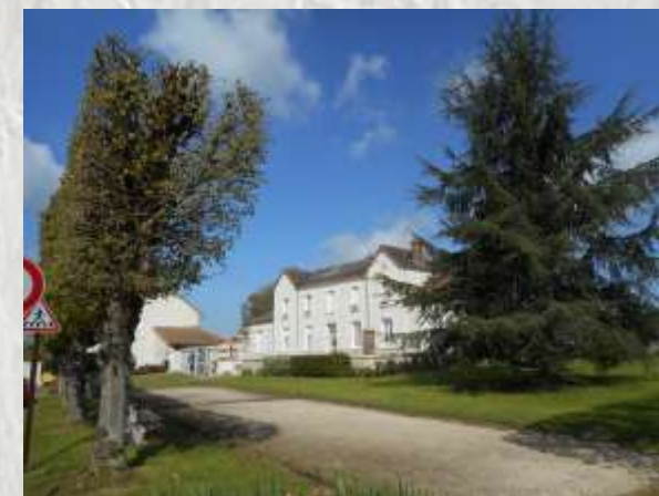
Place de la mairie à Mortery

Au long de ce parcours au travers la campagne de la Brie provinoise, vous découvrirez trois anciennes léproseries sur les sites de Mortery, Mourant et Guériton