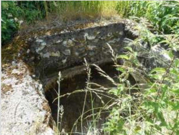
Une source du Durteint