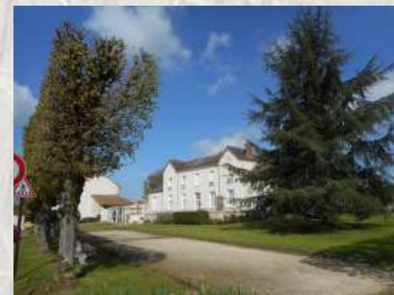
Place de la mairie à Mortery

Connue depuis l'antiquité, la lèpre s'est répandue en Europe, au Moyen-âge, importée par les croisés. Les lépreux étaient alors isolés dans des léproseries ou maladreries afin d'éviter la propagation de la maladie. Au long de ce parcours au travers la campagne de la Brie provinoise, vous découvrirez trois de ces anciens sites : Mortery, Mourant et le Guériton