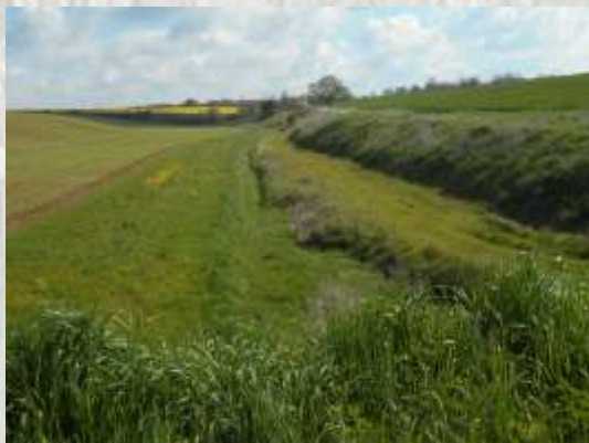
Le vallon du Durteint près de sa source

En 1900, l'activité économique du village est très réduite, en revanche, il y a de nombreuses fermes importantes Guériton, Marolles, Bois Bourdin, Limars, Mourant, souvent des anciens sites de maladreries du moyen-âge.