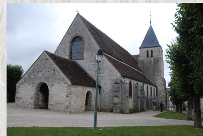
L'Église de Gouaix

C'est une randonnée « en montagnes russes » qui vous surprendra, à travers campagne et forêt. Elle vous fera découvrir de magnifiques points de vue sur le village de Gouaix, sur la vallée de la Seine et au loin, sur les collines de l'Yonne.