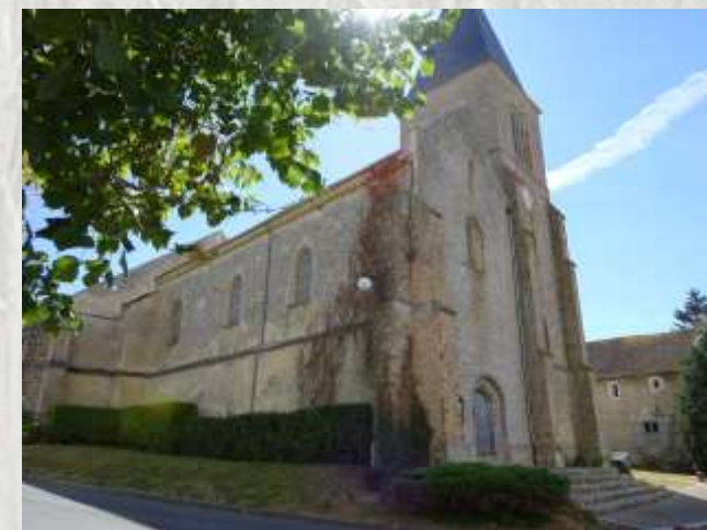
L'Église de Maisoncelles-en-Brie – Photo CD ©

Sur le plateau de la Brie, dans un paysage très ouvert, découvrez hameaux et corps de fermes typiques en parcourant de larges chemins ombragés.