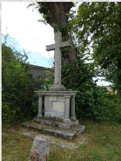
Maisoncelles-en-Brie : Le Calvaire

Abélard rentra par la suite à l'abbaye de Saint-Denis, afin d'échapper à ses ennemis. Il se réfugia à Maisoncelles ou de nombreux auditeurs vinrent écouter ses récits. Il enseigna les sciences profanes et la théologie. Il fonda une école, le Paraclet (situé à Nogent-sur-Seine) puis s'éloignant d'Héloïse, ils entamèrent une longue correspondance mystique et passionnée, savante et religieuse. Détesté par ses confrères philosophes, voire même religieux, il dut fuir le Paraclet car il fut accusé de briser les tabous existant depuis toujours. Il est le fondateur en France, de la liberté de parler et d'écrire, dont la liberté de la presse.