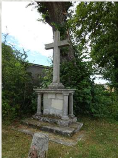
Maisoncelles-en-Brie : Le Calvaire

Abélard rentra par la suite à l'abbaye de Saint-Denis, afin d'échapper à ses ennemis. Il se réfugia à Maisoncelles ou de nombreux auditeurs vinrent écouter ses récits. Il enseigna les sciences profanes et la théologie. Il fonda une école, le Paraclet (situé à Nogent-sur-Seine) puis s'éloignant d'Héloïse, ils entamèrent une longue correspondance mystique et passionnée, savante et religieuse. Détesté par ses confrères philosophes, voire même religieux, il dut fuir le Paraclet car il fut accusé de briser les tabous existant depuis toujours. Il est le fondateur en France, de la liberté de parler et d'écrire, dont la liberté de la presse.