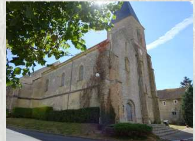
L'Église de Maisoncelles-en-Brie

Sur le plateau de la Brie, dans un paysage très ouvert, découvrez hameaux et corps de fermes typiques en parcourant de larges chemins ombragés.