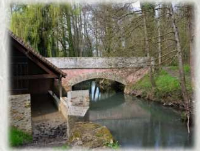
L'Aubetin au Poncet

L'itinéraire parcourt prairie, forêts, berges du Grand-Morin et ruelles de hameaux typiques. Il est jalonné de « lavoirs », également appelés « tribunaux de la médiance », tous restaurés.