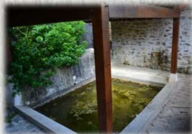
Lavoir de Saint-Aulde