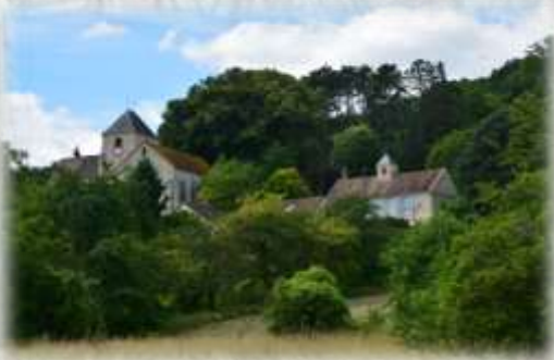
Église de Saint-Aulde