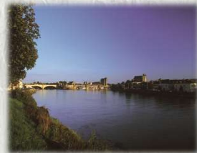
Montereau Fault Yonne

Accroché au flanc de la colline de Surville, le prieuré domine la Seine. Les belvédères sur le parcours offrent aux randonneurs de larges panoramas sur la plaine de Montereau et la vallée de la Seine..