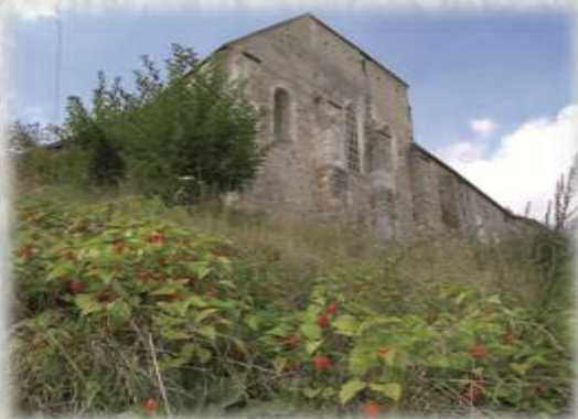
Montereau : Le Prieuré Saint Martin

Des fouilles sont entreprises et mettent à jour dans l'ancienne chapelle des vestiges des XI e et XIII e siècles en particulier des sarcophages dont certains réemplois sont visibles dans les contreforts. Le Prieuré est en plein cœur de la Réserve naturelle de la Colline St-Martin et des Rougeaux. Ce site présente une grande richesse floristique, offre un intérêt paysager et une diversité biologique peu commune qui, ajouté à son intérêt historique, mérite d'être parcouru.