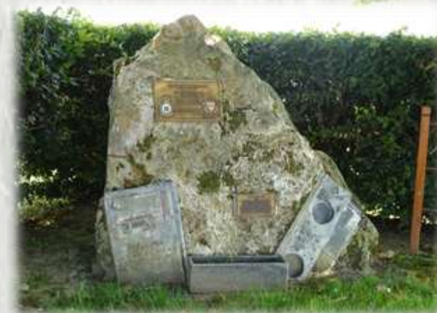
Basseville : Stèle à la mémoire des aviateurs (Lancaster écrasé en 1944)

De la vallée de la Marne au plateau de Brie, découvrez de charmants villages et de solides corps de ferme, tout en profitant de larges panoramas sur le Pays Fertois.