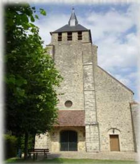
L'Église de Basseville

Stèle de la seconde guerre mondiale : Dans la nuit du 18 au 19 juillet 1944, le bombardier britannique de la Royal Air Force JB 318, parti de la base d'East Kirby s'écrase à Basseville, au lieu-dit « la Boue ». Sur les 7 membres d'équipage qu'il avait à son bord, 4 ont été retrouvés morts dans les jours qui suivirent. Une stèle a été érigée en leur mémoire.