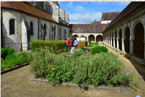
Donnemarie-Dontilly : Le Cloître

Conçu par le paysagiste Christophe Grunenwald, le jardin médiéval de Donnemarie-Dontilly est sans doute unique en Europe. Construit sur l'emplacement d'un ancien cimetière, dans le cloître (XV ème siècle) de l'église, le jardin a pour thème la Vie et la Mort. Douze rectangles symbolisent les douze apôtres et les douze mois de l'année. Les parterres bordés de grès roses, l'osier tressé environnant les plantes médicinales, les buis taillés, les balustrades en bois sont minutieusement reproduits suivant des documents anciens. Au centre, la rose de Provins, l'ancolie, l'angélique, et le lis restituent des parfums oubliés. Les feuilles des Larmes de Job évoquent sa tristesse décrite dans la Bible. Les graines servaient à faire des chapelets.