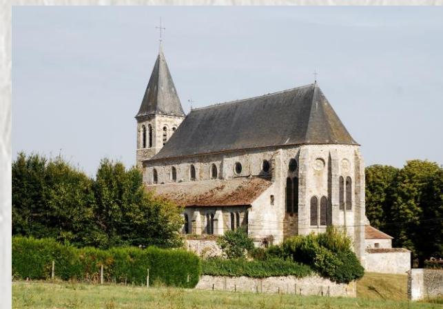
L'Église de Dontilly

Le Montois, entre la plaine de Brie et la vallée de la Seine, est une identité à reconnaître. Des surprises à découvrir sur le plan architectural, châteaux et églises comme pour les espaces boisés ou jardinés.