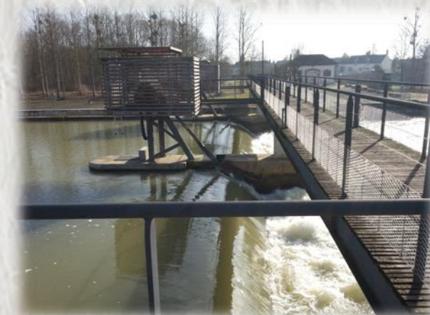
Le barrage de Jaulnes –vu côté amont

Au cœur de la vallée de la Bassée, marchez sur les pas de César. Jusqu'en 1498, la voie (romaine) Agrippa reliant Lyon à Boulogne-sur-Mer traversait la Seine à Jaulnes, puis le pont de Bray fut construit.