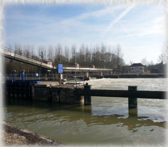
Le barrage de Jaulnes –vu côté aval

Parmi les particularités liées à cette approche « durable », on peut apprécier les logements dans lesquels sont abrités les moteurs qui ressemblent à des cabanes de pêcheurs sur pilotis, un escalier passage et frayère à poisson, l'alliance harmonieuse entre bois et pierre. L'effort de préservation du milieu s'est aussi porté sur les plantations, l'éclairage et la minimisation de l'impact visuel de l'ouvrage. Le barrage de Jaulnes a reçu le prix spécial de l'architecture contemporaine de Seine et Marne.