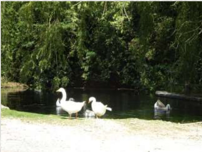
La Cressonnière