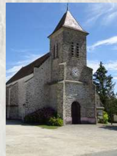
L'Église de Marolles-en-Brie

Cette courte randonnée vous montrera en quelques kilomètres les principaux paysages de la Brie Laitière : un vallon, celui du Vannetin, un charmant village, Marolles-en-Brie avec son église, son lavoir, son ancien château et sa ferme et pour être complet un peu de plateau.