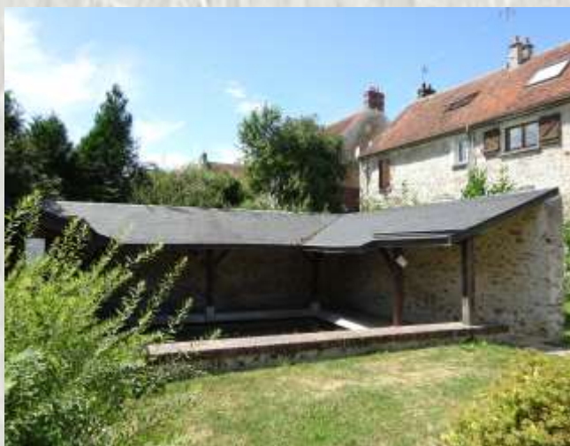
Lavoir de Marolles-en Brie

Le pétrole de Marolles-en-Brie a été exploité à la fin du 20ème et au début du 21ème siècles au hameau de la Malnoue et près de la ferme de la Cressonnière. Le pétrole était extrait entre 1 700 et 2 500 mètres, avec une production de 89 barils par jour, soit 30 000 l/jour. Il était dirigé par un pipe-line de 11,5 km au dépôt de Vaudoy-en-Brie avant d'être traité à la raffinerie de Grandpuits.