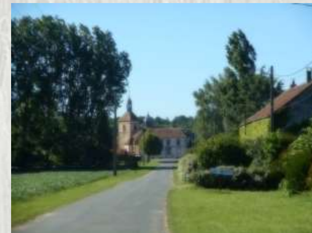
Les Marêts

Au milieu de la campagne, de villages en hameaux, cette randonnée vous fera découvrir : ferme seigneuriale, prieuré, château, églises, au riche passé historique.