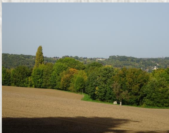
Jouarre : vue sur la vallée du Petit-Morin