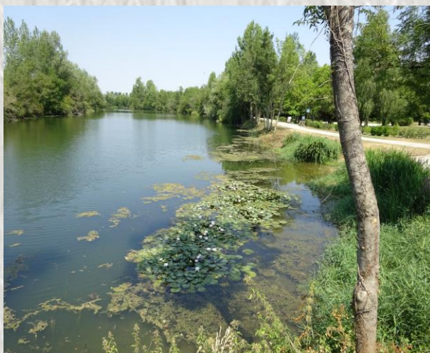
Ancien méandre de la Seine à Gravon

Cette partie originale de la vallée de la Seine, à la faune et à la flore particulière des gravières, a été fortement marquée par les inondations du fleuve. Les espèces préservées de la flore sont : la violette élevées, disparue des autres sites de l'Ile de France, l'ail anguleux que l'on trouve à Jaulnes, l'inule jaune des fleuves et la gratiolo officinale purgative. Ces prairies sont protégées. La faune est également attractive avec la très curieuse grenouille arboricole (qui grimpe aux arbres). Sa silhouette est difficile à observer. « il pleut, il mouille, c'est la fête à la grenouille », chantent parfois les enfants... De nombreux oiseaux migrateurs se reposent dans les gravières de la rive gauche de la Seine.