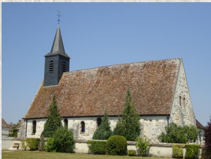
L'Église de Gravon