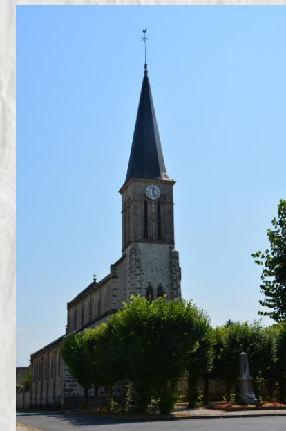
L'Église de Balloy

Décor insolites pour cet itinéraire, par les étangs, les canaux et les marécages de l'ancien lit de la petite Seine. Des rencontres insoupçonnées avec la faune et la flore des sablières.