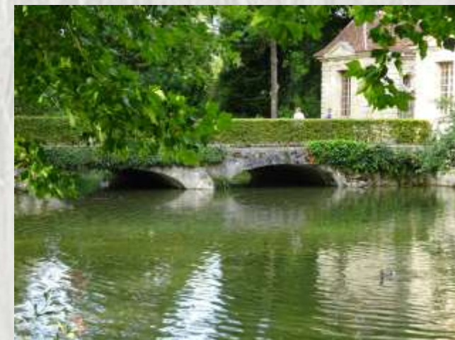
Parc des Capucins – Photo CD ©

Découvrez coulommiers, le pays du fromage et de l'imprimerie : une promenade qui vous conduira des rives du Grand-Morin à la commanderie des Templiers bordée par son jardin médiéval.