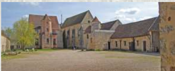
La commanderie de Coulommiers

Fondée en 1173, c'est l'exemple le plus complet au nord de la Loire de ce qu'était jadis une commanderie. Elle est d'abord une commanderie templière puis hospitalière. Vendue comme bien national à la Révolution à un fermier, elle reste la « ferme de l'Hospital » jusqu'en 1964, date à laquelle la municipalité décide de la racheter. Dès 1966, le site est restauré bénévolement par des passionnés. Depuis 1990, l'association ATAGRIF et la ville de Coulommiers perpétuent la protection et la mise en valeur du site, classé Monument Historique depuis 1994.