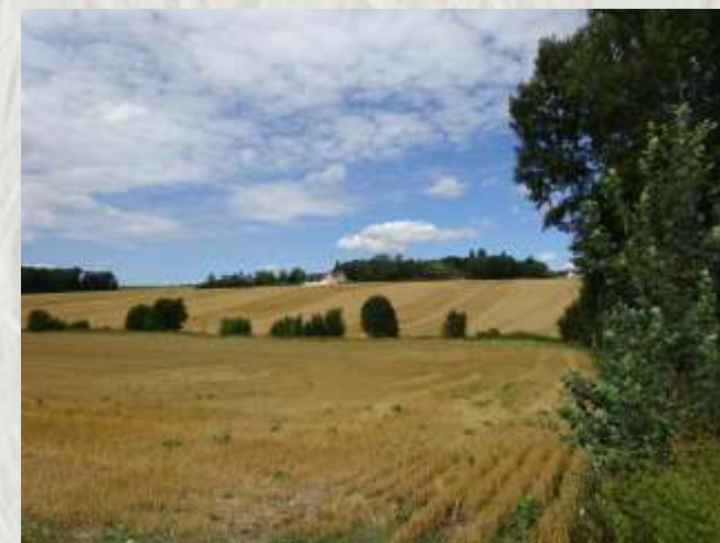
Vallon de Raboireau, les Limons de Chauffry

Au cours de cette randonnée, vous découvrirez des vergers expérimentaux installés par le lycée agricole du château de La Bretonnière.