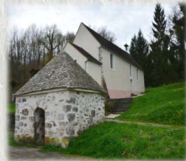
St-Augustin, source de Ste-Aubierge

Au cœur de la vallée de l'Aubetin, découvrez l'ancienne demeure du Seigneur Gueric, le moulin où vécut Vercors et la petite chapelle Sainte-Aubierge.