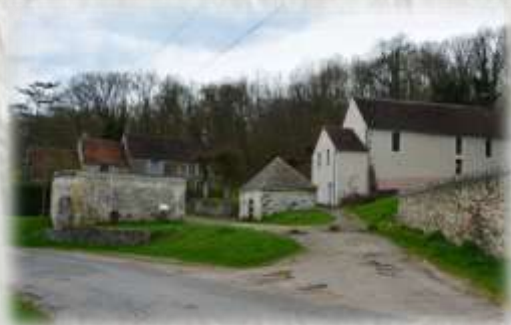
St-Augustin, site de Ste-Aubierge

C'est au XII ème siècle qu'Aubierge, fille d'un roi d'Est-Anglie se retire avec sa sœur Sédride en l'abbaye de Faremoutiers, fondée par sainte Fare, dont elle deviendra plus tard abbesse. La première chapelle fut construite au XII ème siècle, c'est un petit oratoire au bord de l'Aubetin. Elle fut entièrement reconstruite en 1714 sur l'ordre de madame de Beringhen, 44 ème abbesse. La source, au pied de la chapelle, fut d'abord un lieu de dévotion païenne probablement liées à des rites gallo-romains. Elle est christianisée lors de l'évangélisation de la région sous l'influence des moniales de Faremoutiers. En 1712, des anglais, en pension à l'abbaye, la couvrent d'un édicule en pierre. La source était réputée dans toute la Brie pour ses vertus miraculeuses. La pureté et la fraîcheur de son eau ont motivé la tradition populaire préconisant « celle qui boit à cette source se mariera dans l'année ».