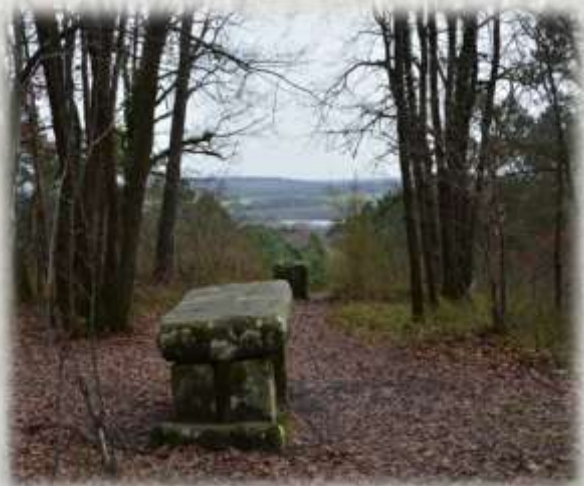
La table du roi

Un vaste espace naturel, composé d'étangs, de marais, de prairies et de bois. Des observatoires ornithologiques permettent de regarder discrètement les oiseaux stationnant sur les étangs et les îlots. (parcours glissant en bord du Loing en cas de pluie).