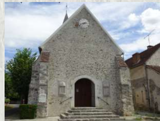
L'Église de Dagny-Saint-Géroche

Depuis le VII ème siècle, pour un mariage réussi, les futurs époux invoquent le nom de Saint-Géroche dont l'église de Dagny a gardé le chef. Peut-être verrez vous également « l'Épine qui fleurit deux fois »