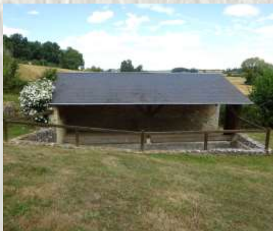
Dagny-Saint-Géroche : Le Lavoir

Selon la légende, un soir de Noël, au VII ème siècle, l'abbé saint Géroche, parcourant la campagne un bâton d'épine à la main, parvient à échapper à deux bandits. Harassé après la lutte, il s'assied en enfonçant dans la terre son bâton, qui prit racine. Depuis l'épine fleurit deux fois par an, à Noël, et au printemps. Aucune bouture faite à partir de cet arbre ne présente cette anomalie. La floraison hivernale pourrait s'expliquer par le fait que l'eau de la source Saint-Géroche est légèrement tiède. L'épine donnait lieu autrefois, le 05 juillet, jour de la fête du saint, à un pèlerinage ; des rubans étaient accrochés au buisson. Afin d'éviter que trop de branches ne soient emportées, on signale aux visiteurs : « Si vous coupez une branche de l'épine, vous aurez la figure retournée en arrière. »