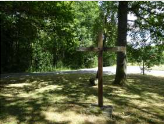
Dagny-Saint-Guéroche : Croix Camus