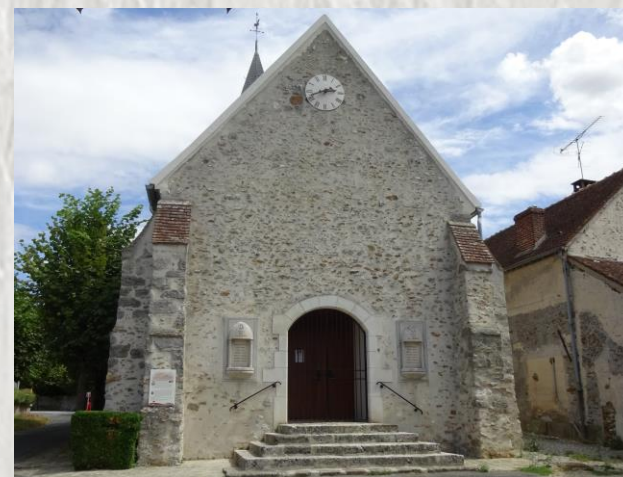
L'Église de Dagny-Saint-Géroche

Depuis le VII ème siècle, pour un mariage réussi, les futurs époux invoquent le nom de Saint-Géroche dont l'église de Dagny a gardé le chef. Peut-être verrez vous également « l'Épine qui fleurit deux fois »