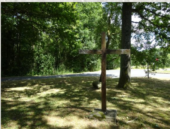
Dagny-Saint-Guéroche : Croix Camus