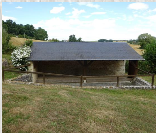
Dagny-Saint-Guéroche : Le Lavoir

Selon la légende, un soir de Noël, au VII ème siècle, l'abbé saint Géroche, parcourant la campagne un bâton d'épine à la main, parvient à échapper à deux bandits. Harassé après la lutte, il s'assied en enfonçant dans la terre son bâton, qui prit racine. Depuis l'épine fleurit deux fois par an, à Noël, et au printemps. Aucune bouture faite à partir de cet arbre ne présente cette anomalie. La floraison hivernale pourrait s'expliquer par le fait que l'eau de la source Saint-Géroche est légèrement tiède. L'épine donnait lieu autrefois, le 05 juillet, jour de la fête du saint, à un pèlerinage ; des rubans étaient accrochés au buisson. Afin d'éviter que trop de branches ne soient emportées, on signale aux visiteurs : « Si vous coupez une branche de l'épine, vous aurez la figure retournée en arrière. »