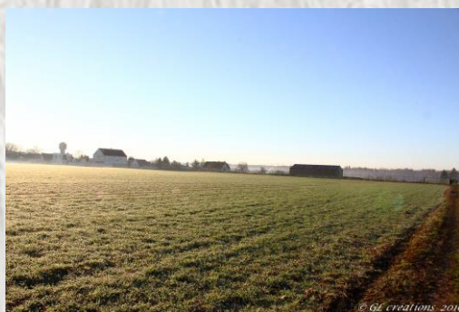
Boissise la Bertrand

Les bois sont plantés de plusieurs essences telles que : acacias, bouleaux, charmes, châtaigniers, chênes. Habités de gibiers tels que : chevreuils, renards, sangliers, lièvres et aussi de petits rongeurs (musaraignes, mulots) sans oublier des écureuils.