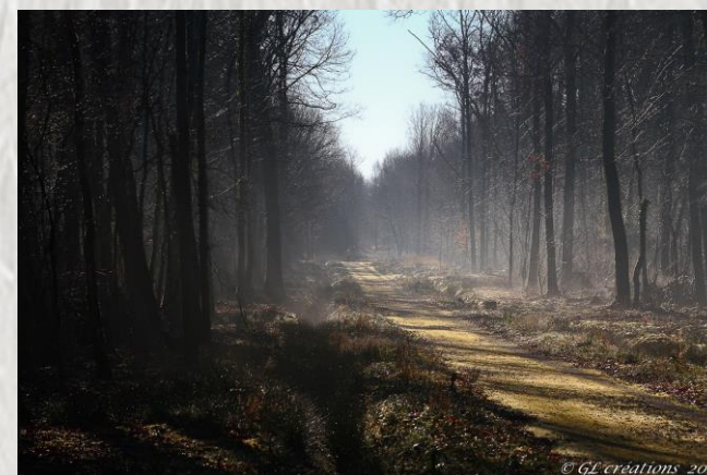
Boissise la Bertrand

A l'ouest de Melun, le plateau surplombant les méandres de la Seine a conservé sa couverture boisée. C'est au travers celle-ci, par les bois des Joies, des Courtilleaires et de Bel Air que vous conduira ce parcours bucolique et majoritairement forestier.