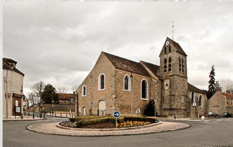
L'église de Boissise-la-Bertrand

Le balisage de l'itinéraire que vous empruntez est réalisé et entretenu par les 250 baliseurs du comité départemental de la Randonnée Pédestre de Seine et Marne (Codérando 77). Il fait partie des 4500 km de chemins de promenade et de randonnée existant sur le département.