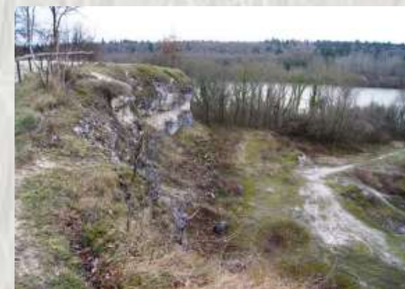
Forêt de Rougeau-Carrière du four à chaux

Ce circuit traverse la ville nouvelle de Sénart par ses canaux et ses bassins, visite la forêt de Rougeau et offre d'étonnants points de vue sur la vallée de la Seine.