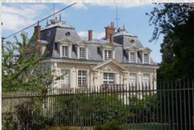
Pavillon Royal

Sur ce site, l'Agence des Espaces Verts d'Ile-de-France a souhaité valoriser les aménagements paysagers originaux conçus aux XVIII ème et XIX ème siècles. L'axe principal a été matérialisé, et rallie l'Allée Royale dont vous pouvez relire l'histoire sur le site même.