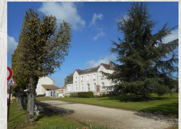
Place de la mairie à Mortery

Connue depuis l'antiquité, la lèpre s'est répandue en Europe, au Moyen-âge, importée par les croisés. Les lépreux étaient alors isolés dans des léproseries ou maladreries afin d'éviter la propagation de la maladie. Au long de ce parcours au travers la campagne de la Brie provinoise, vous découvrirez trois de ces anciens sites : Mortery, Mourant et le Guériton