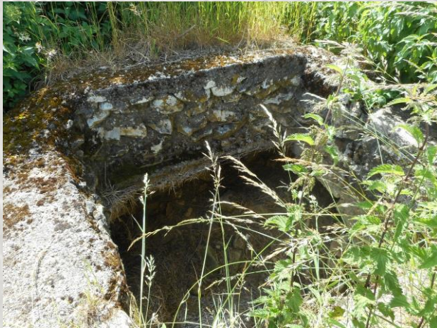
Une source du Durteint