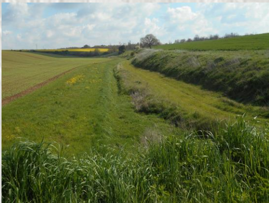
Le vallon du Durteint près de sa source

En 1900, l'activité économique du village est très réduite, en revanche, il y a de nombreuses fermes importantes Guériton, Marolles, Bois Bourdin, Limars, Mourant, souvent des anciens sites de maladreries du moyen-âge.