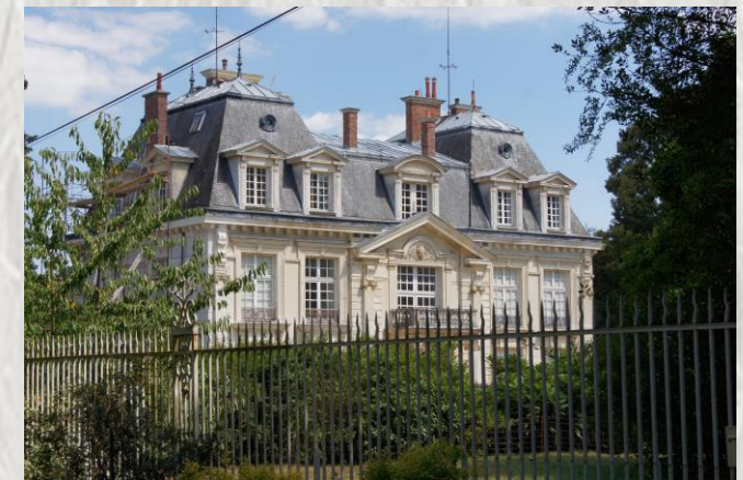
Pavillon Royal

Ce circuit traverse la ville nouvelle de Sénart par ses canaux et ses bassins, visite la forêt de Rougeau et offre d'étonnants points de vue sur la vallée de la Seine.