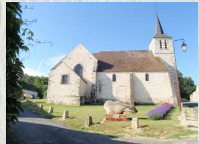
Eglise de Villemaréchal

Lancez-vous dans une promenade champêtre à la découverte de deux charmants villages du Gâtinais, dont Villemaréchal, qui fut une place forte médiévale. Vous trouverez également quelques souvenirs du Maquis.