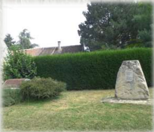
La résistance en Gâtinais

Figure de la Résistance, Edmond Trembleau organisait le ravitaillement local durant la Seconde Guerre mondiale. Aucune de ses denrées ne tomba dans les mains ennemies. Il rallia à partir des années 1940 de nombreux résistants des villages alentours et n'hésita pas à héberger chez lui un aviateur britannique. Proche de la capitale, la région parsemée de bois et de bocages, fut un cadre idéal pour organiser la Résistance. Ainsi deux parachutages alliés furent orchestrés sur les terres de la « Croix-Blanche », un fait symbolisé aujourd'hui par une stèle. Bien que blessé au cours d'une attaque allemande, c'est beaucoup plus tard, en 1971, que le père Trembleau décèda. Son corps repose au cimetière de Paley.