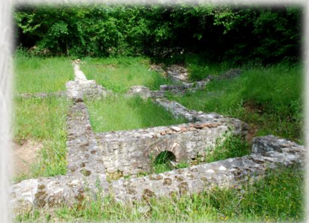
La cave aux Fées

La vallée du Lunain traverse le Bocage Gâtinais jusqu'à Moret-sur-Loing. Paley, au carrefour de deux voies romaines, dresse son donjon sur un site autrefois consacré au dieu Mercure.