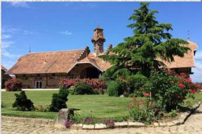
La Ferme de Forest

En 1693, Louis XIV nomme François organiste de la Cour. Celui-ci laissera une œuvre considérable, pour orgue, clavecin, musique de chambre, ainsi qu'un traité sur l'art de toucher le clavecin.