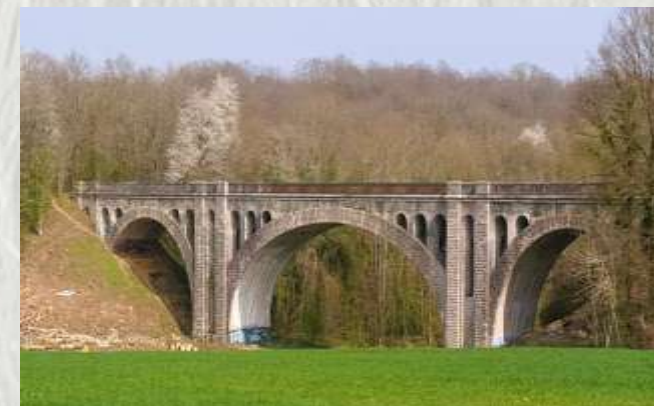
Viaduc ferroviaire

Ce circuit vous invite à découvrir une des nombreuses fermes qui jalonnent le plateau briard : la ferme de Forest. Enclose de toutes parts, ses toits pentus encadrent un porche colombier très curieux.