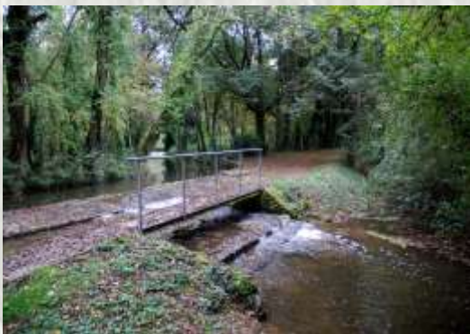
Le guésur le Bréon