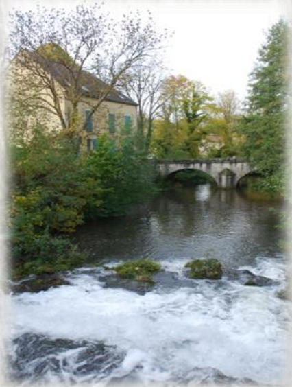
L'Orvanne à Écuelles

Situé dans un hameau d'Écuelles, le château de Ravannes, maintes fois démolé puis reconstruit entre le Vème et le XIXème siècle, n'est plus aujourd'hui que gravure dans les livres d'histoire locale. La Reine Frédégonde, tutrice de Clotaire II, y demeura à la fin du VIème siècle, le jeune roi Louis XIII y séjourna en 1611. Lors des noces de Louis XV à Fontainebleau en 1725, c'est à Ravannes que le roi de Pologne Stanislas Leszcynski, père de la mariée s'installa ! Ne subsiste aujourd'hui du château qu'une glacière et une pièce d'eau dotée d'une cascade et d'un mur d'enceinte. Seul véritable édifice d'époque conservé intact depuis sa construction sous François 1 er , un pont formé de trois arches qui franchit l'Orvanne.