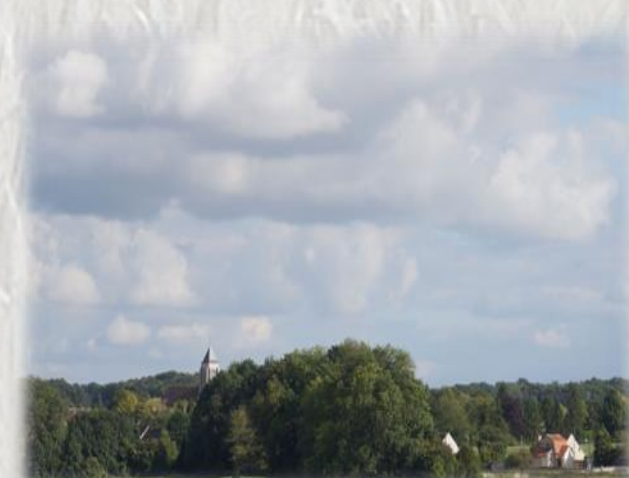
En basse vallée du Lunain – Photo S.J ©

Un parcours à la découverte du Lunain, affluent du Loing, du plateau agricole et de sites d'anciennes industries.