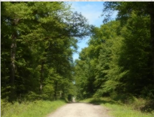
Route forestière St Nicolas en forêt de Sourdun – Photo S et JM P ©

La fontaine St-Martin : La fontaine St-Martin des XIXème et XXème siècles, construite de pierres et de briques est alimentée par un aqueduc souterrain. Elle est à l'origine du ru qui traverse la commune et se jette dans le Resson à St-Nicolas la Chapelle. Ce point d'eau était déjà attesté en 1663.