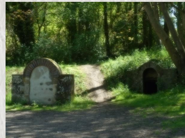
Chalautre-la-Grande : La fontaine St Martin

Découvrez lors cette randonnée des paysages variés avec de beaux panoramas sur la campagne, la vallée de la Seine et Chalautre-la-Grande. Le parcours traversant village, campagne, bois et forêt de Sourdun vous séduira.